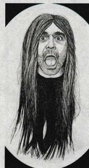
A la izquierda, la obra autorretrato, y en la imagen de arriba la pintura «Mi cabeza reducida como la de un Jíbaro»

La muestra se completa con seis dibujos realizados mediante tramas gráficas con tinta sobre papel. En estas obras «Ostern» realiza el juego surrealista y absurdo autorretratándose en los cuerpos y esqueletos de especies animales.